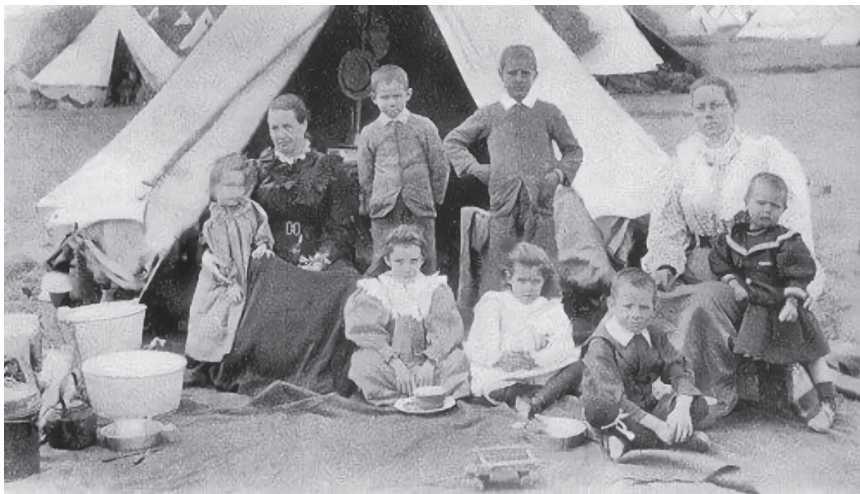
Búrské ženy a deti v koncentračnom tábore

V roku 1900 Anglicko porazilo búrsku armádu a vyhlásila okupované územia za svoje vlastné, no Búrovia sa nevzdávali a zahájili partizánsku vojnu. Viac ako 20 tisíc Búrov pod vedením troch bojovných generálov pokračovalo v odpore a spôsobilo okupantom nemálo problémov. Angličania odpovedali ničením fariem, masovým zabíjaním dobytká ( zabíjali dobytkov v takom rozsahu, že sami to nemali šancu zjesť a tak tisíce kráv a oviec jednoducho zhnili ) 24 a organizovaním koncentračných táborov pre civilistov, väčšinou ženy a deti, pretože v podstate všetci muži bojovali.