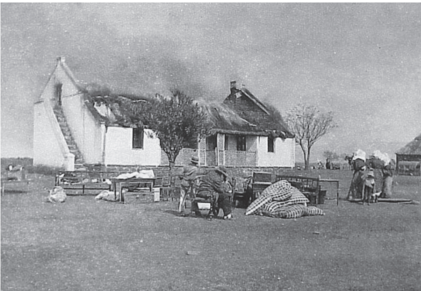
Horiaca búrska farma

„Staré dobré Anglicko“ ( zrejme zo svojej veľkej dobroty ) ako prvé na svete vymyslelo koncentračné tábory! Prvé koncentračné tábory pre civilistov vytvoril anglický lord Horatio Herbert Kitchener (1850–1916) v Južnej Afrike pre búrske rodiny počas takzvanej anglo-búrkej vojny (1899–1902). Búrovia boli belosi, potomkovia holandských, francúzskych a nemeckých kolonistov, ktorí sa v Afrike usadili už v 17. storočí. Angličania im najprv zobrali pôdu a majetok a vyhnaní ich hlboko do vnútrozemia kontinentu, pretože Angličanom sa ich miesto pobytu v Afrike páčilo ako výhodný oporný bod pre plavbu do Indie.