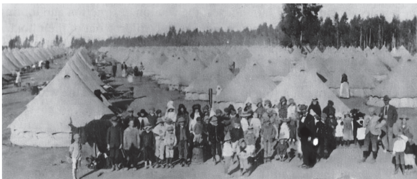
Koncentračný tábor pre Búrov

V roku 1900 Anglicko porazilo búrsku armádu a vyhlásila okupované územia za svoje vlastné, no Búrovia sa nevzdávali a zahájili partizánsku vojnu. Viac ako 20 tisíc Búrov pod vedením troch bojovných generálov pokračovalo v odpore a spôsobilo okupantom nemálo problémov. Angličania odpovedali ničením fariem, masovým zabíjaním dobytká ( zabíjali dobytkov v takom rozsahu, že sami to nemali šancu zjesť a tak tisíce kráv a oviec jednoducho zhnili ) 24 a organizovaním koncentračných táborov pre civilistov, väčšinou ženy a deti, pretože v podstate všetci muži bojovali.