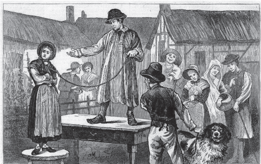
WIFE AUCTION IN ENGLAND.

Rovnako odporne, ako s chudobnými mužmi a deťmi, zachádzalo „staré dobré Anglicko“ aj s chudobnými ženami. Veď ono sa ani s ostatnými ženami príliš nemaznalo. Je totiž známe, že od začiatku 17. do začiatku 20. storočia existoval v „starom dobrom Anglicku“ zvyk predávať manželky 75 . Keďže rozviest sa bolo veľmi komplikované ( s výnimkou tých najbohatších ), manželky, ktoré sa mužom zunovali alebo znepáčili, vystavovali na dražbe, kde ich získal ten, kto ponúkol najviac.